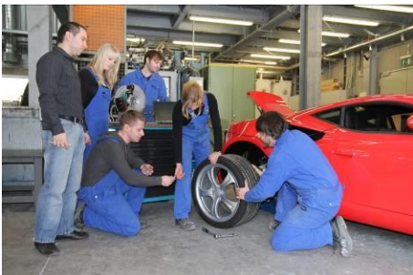
Abb. 3: Interne Mitarbeiterschulung am Fraunhofer IFAM.