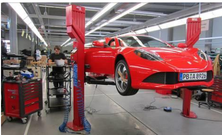
Abb. 1: Aufbau und Inbetriebnahme des »Fraunhofer electric concept car – Frecc0«. Die Erfahrungen aus verschiedenen Projekten am Fraunhofer IFAM fließen in die Entwicklung des Zertifikationsprogramms Elektromobilität ein.