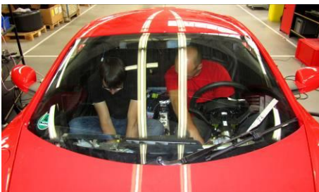
Abb. 2: Vorbereitung der ersten Probefahrt des »Fraunhofer electric concept car – Frecc0«.